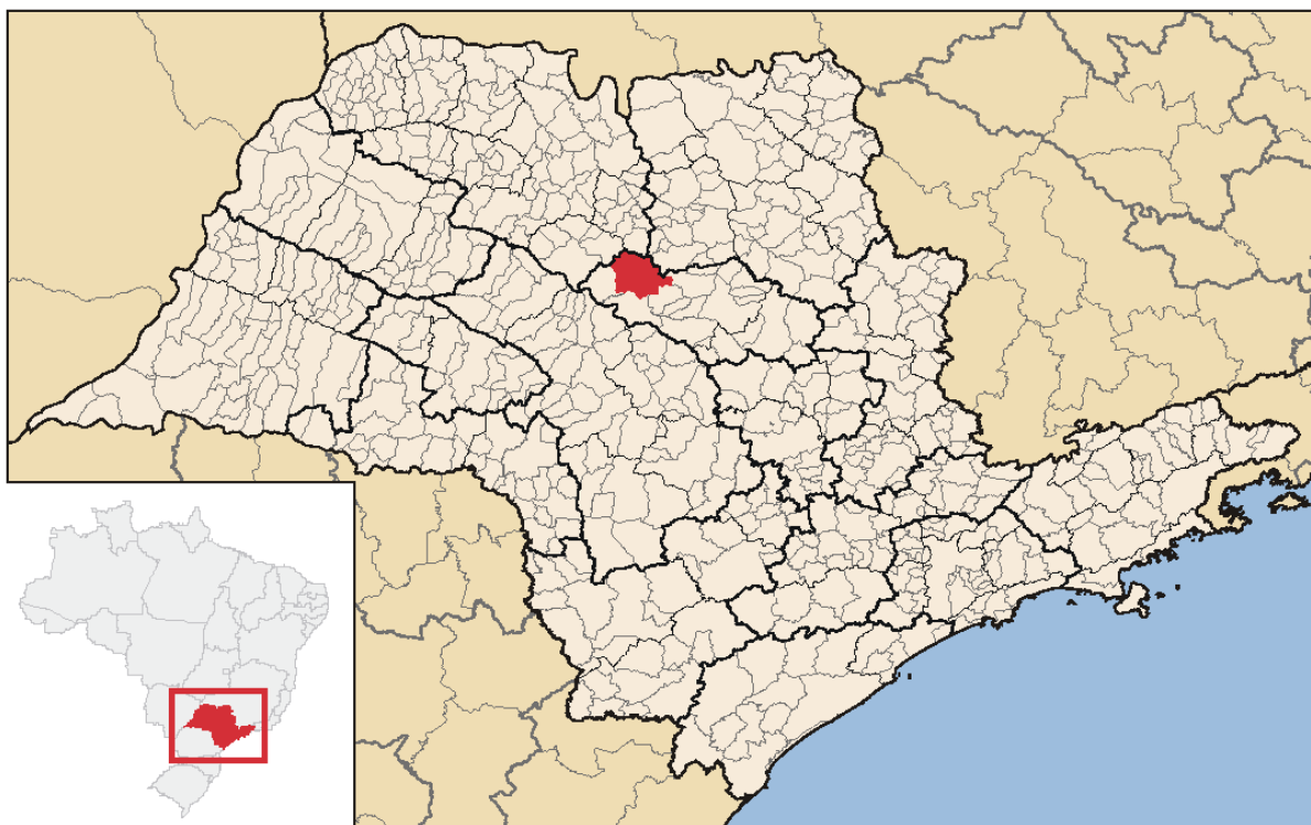
Figura 01. Localização do município de Itápolis no Estado de São Paulo